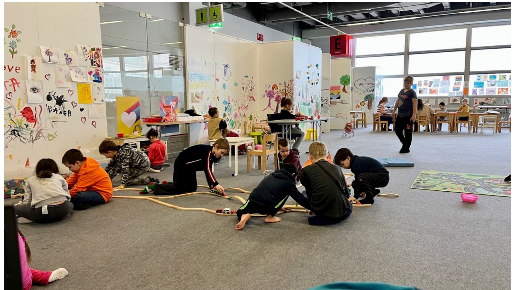
Abbildung: die Kinderbetreuung in der Erstaufnahmeeinrichtung Frankfurt Messe

Die ASB Lehrerkooperative setzt sich seit Jahren für die sprachliche, berufliche und gesellschaftliche Integration und die Förderung von Bildungs- und Chancengleichheit ein. Die pädagogischen Angebote werden fortlaufend weiterentwickelt, um Kinder bestmöglich zu fördern und Eltern die Vereinbarkeit von Familie und Beruf zu ermöglichen. Dabei ist der Fachkräftemangel auch hier eine wesentliche Herausforderung, der wir begegnen. Neben politischen Bemühungen eine Aufwertung des Berufsbildes zu erzielen, wird die ASB Lehrerkooperative auch eigene Maßnahmen zur Fachkräftegewinnung und -sicherung ergreifen: in Kürze wird eine Personalwerbekampagne an den Start gebracht, um Interessenten auf die Angebote der Lehrerkooperative aufmerksam zu machen und hierfür zu begeistern. Darüber hinaus erweitert die ASB Lehrerkooperative ihre Präsenz durch die Etablierung von Bildungsstätten an neuen Standorten. Mit der Sport-Kita in Langen ist die Lehrerkooperative nun an vier Standorten (Frankfurt, Offenbach, Obertshausen, Langen) im Rhein-Main Gebiet aktiv.