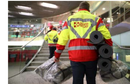
Kältehilfe - Aktion