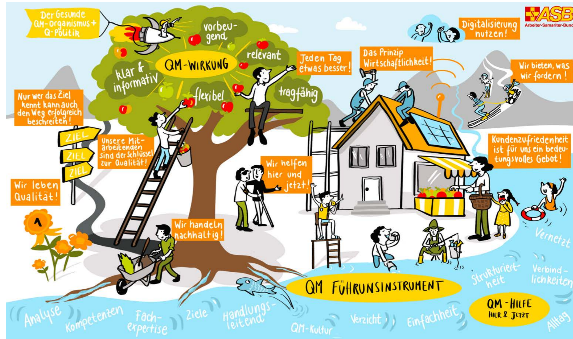
Die Abbildung zeigt das neue QM - Wimmelbild. Das interaktive QM-Wimmelbild mit anklickbaren Elementen ist zu finden unter: https://www.asb-hessen.de/qm-wimmelbild/

Neben dem kontinuierlichen Ausbau eines wirkungs- und risikoorientierten Qualitätsmanagement-Systems soll künftig die Stärkung von Risikomanagement und Auditierung sowie das Thema Digitalisierung vorangetrieben werden. So ist in diesem Jahr die Ausweitung der roXtra-Plattform um eine Software zum Risikomanagement geplant. Die Digitalisierung in unseren Leistungsbereichen soll auch zu einer Verschlinkung der QM-Dokumentation führen. Insgesamt arbeiten wir stetig an einer stärkeren Vernetzung zwischen dem Verein und seinen Tochtergesellschaften, um gemeinsam unsere Ansprüche an eine hohe Qualität in ganz Hessen sicherzustellen.