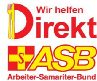
Projekt - Wir helfen Direkt