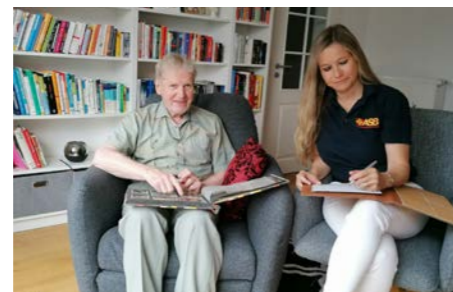
Projekt - Glücksgeschichten