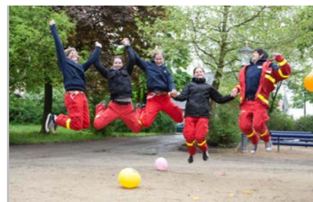
Projekte der ASJ