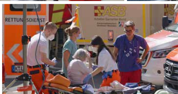
Die Rettung und Versorgung von Flutopfern sowie die Betreuung Evakuierter in Notunterkünften standen an erster Stelle.