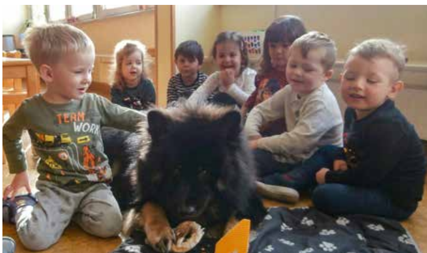
Im Kreise der Gratulant*innen: Kindergartenhund Gino feiert seinen ersten Geburtstag.