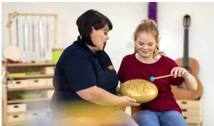
Arbeitgeber schätzen die Qualifikationen, die man in einem Freiwilligendienst erwerben kann.