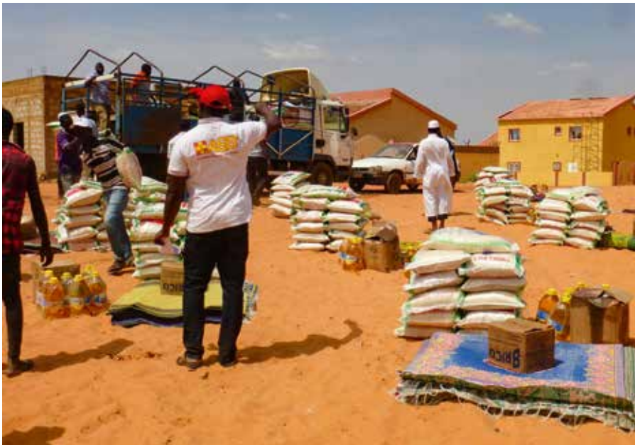
Derzeit verteilt der ASB Matten und Seife sowie Reis, Nudeln und Öl an über 250 Haushalte aus dem Überschwemmungsgebiet.