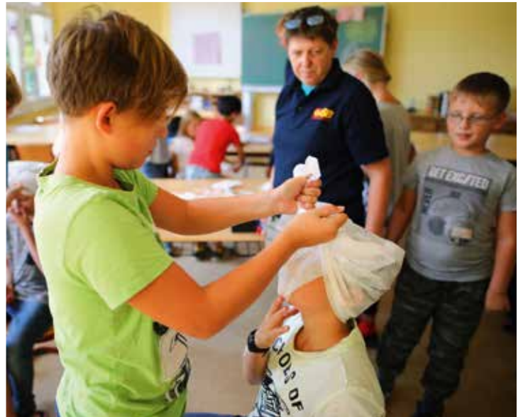
Schon Kinder lassen sich spielerisch für Erste Hilfe begeistern.

Um den Teilnehmerinnen und Teilnehmern die Krisenvorsorge möglichst realitätsnah zu vermitteln, lernen sie, Notfallvorräte selbst zu packen und einfache Wunden und Verbrennungen zu versorgen. Bei der Inszenierung einer Notsituation üben sie, einen kühlen Kopf zu bewahren und eine Überlebensstrategie zu entwickeln. Fragen wie „Was kann ich Essbares in der Natur finden?“ werden ebenso diskutiert wie: „Wie komme ich an Trinkwasser, wenn der Strom für mehrere Tage ausfällt?“