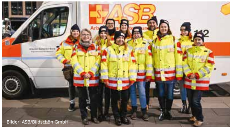
Das Kältehilfe-Team der Kölner Bundesgeschäftsstelle mit ASB-Präsidentin Katarina Barley (3. v. r.).